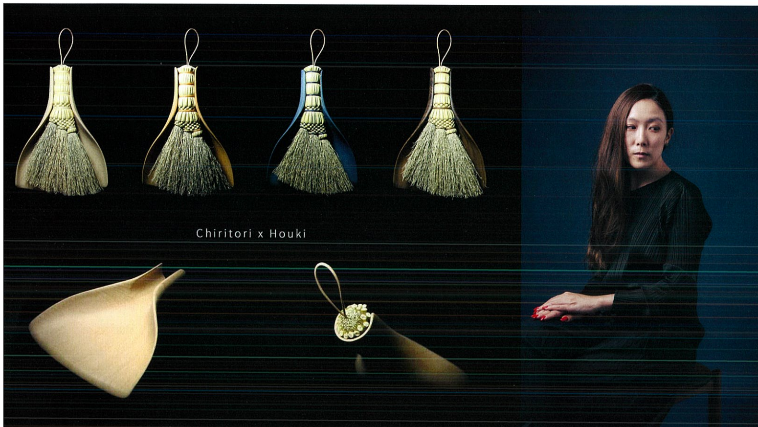
Chiritori x Houki