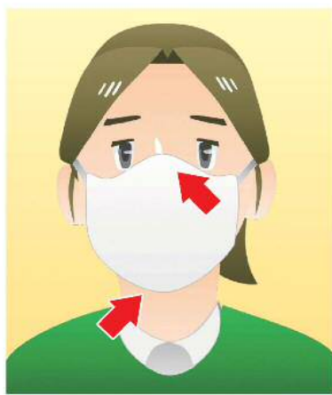
①マスクを着用する (口・鼻を覆う)