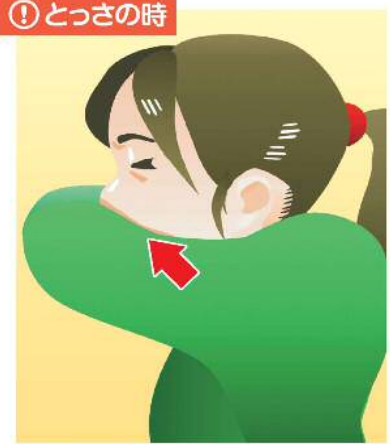
③袖で口・鼻を覆う