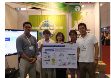
バンコク展示会にて②