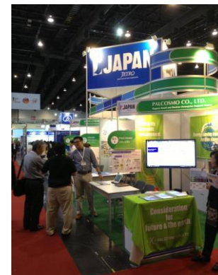
バンコク展示会にて①