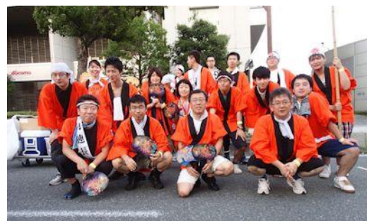
長野びんずる祭り 2015年8月3日