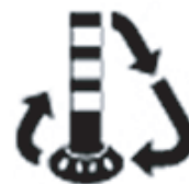
環境にやさしい100%リサイクル可能な製品