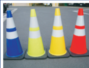
カラーバリエーションが4色と豊富