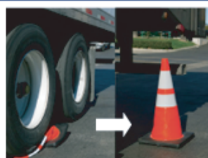
10トントラックに踏まれても復元