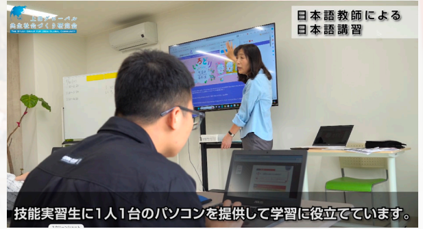
技能実習生に1人1台のパソコンを提供して学習に役立てています。