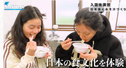
日本の食文化を体験