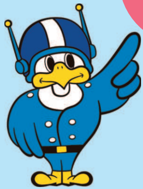
長野県警察 シンボルマスコット 「ライポくん」