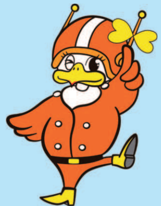
長野県警察 シンボルマスコット 「ライピちゃん」