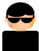
攻撃者 (A社のなりすまし)