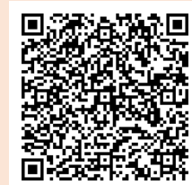
<ホームページQRコード>

https://www.pref.nagano.lg.jp/jinkendanjo/kurashi/jinkendanjo/danjo/main/leader.html