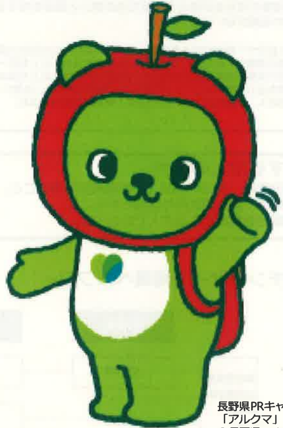
長野県PRキャラクター 「アルクマ」 ©長野県アルクマ

長野県では、今年度から、市町村と共同で、東京圏（埼玉県、千葉県、東京都及び神奈川県）、愛知県又は大阪府から県内に移住し、県が開設・運営するマッチングサイトに掲載する求人に応募して採用された方に、移住支援金（最大100万円）を支給する制度を開始します。