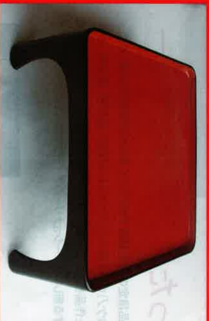
木曽漆器のお膳をReデザイン