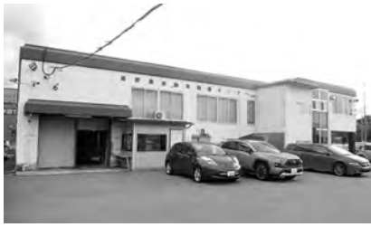
長野県中古自動車販売商工組合 事務所 外観

塩尻市に事務局を置く長野県中古自動車販売商工組合。一般社団法人長野県中古自動車販売協会と共同して「JU長野」を運営し、中古自動車オークションを中心に様々な取り組みを行っています。もともと任意団体だった自動車販売協会が中古自動車オークションの事業を行っていましたが、今後経済活動や業界秩序の維持を広く取り組んでいくため、法人組織を立ち上げようという声が上がりました。昭和54年6月に組合を設立しました。