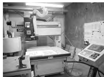
小型精密NCルータマシン