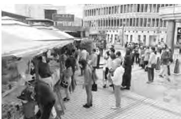
ナガノミライマルシェ当日の様子

地域プロモーション支援事業では、地域創生・活性化に繋がる地域の課題解決を支援。長野市内の起業家や若手事業者を支援する「ナガノミライマルシェ」の企