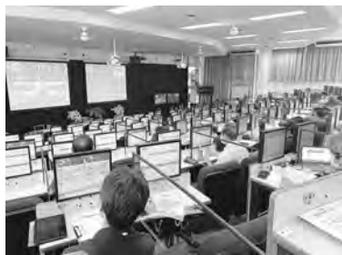
オークション会場

オークションは毎週火曜日12時30分より開催されます。対象は組合員・ディーラー・県外の会員等となります。また、オークションだけに参加したい方へ向け、オークション会員という制度も設けています。組合へ登録が完了するとIDカードが発行され、会場への入場ができるようになります。