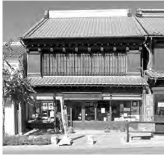
善光寺門前に店を構える柏興紙店

善光寺門前で和紙類を販売していた「柏興紙店」が1891(明治24)年、鉄道切符の受注を機に印刷業に進出したのが、カシヨのルーツ。以来、社は「もっとも古く、もっとも新しく」のもと、1972(昭和47)年全国初のタウン情報誌「月刊ながの情報」を創刊するなどいち早く新しいことに挑戦し、製造業から情報サービス業としての印刷業へと脱皮を図ってきました。