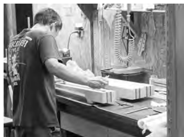
熟練職人によるネックの加工