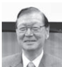
杉山 秀二 商工中金社長