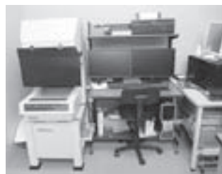
充実した検査体制は検査機器メーカーも驚くほど

ものづくり補助金に採択されたテーマは「超高精度真円度加工技術の開発」。「精度を出すには真円度を出せというのが私の持論。材料の応力を見える化」し、それを取って自動加工するための機械を導入しました。長い時間をかけないとはいきりした結果は出ませんが、今のところ良い結果が得られています」。川手社長によるとすでに大手光学機器メーカーから開発中の製品について引き合いがあり、導入成果も現れているようです。