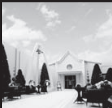
感謝と祝福の笑顔が溢れる メトロポリタンウエディング