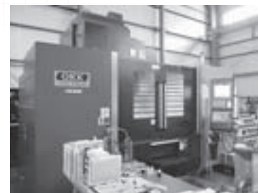
ものづくり補助金で導入したNC加工機