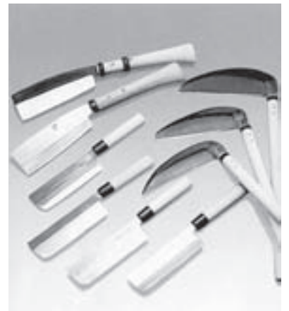
信州打刃物 (鎌、包丁、鉈)

信州鎌は刃が薄く切れ味が大変よく、しかも刈った草が手元に寄ってくるので、使い勝手が良く多くの人々に使われております。往時200人にのぼる鍛冶職人が生活しており、古間宿の発展に大きく関係があったと言われております。現在十数人の職人さんが450年の伝統を受け継ぎ、熟練の技を磨き古間宿で培われた「信州鎌」を心を込めて作っております。古間宿と「信州鎌」は時代を共に歩んできたと言えるでしょう。