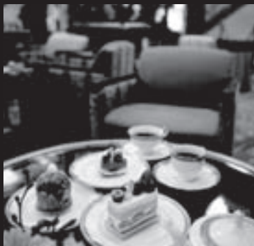
上質で優雅な時間を過ごす ゲストルーム&ロビーラウンジ