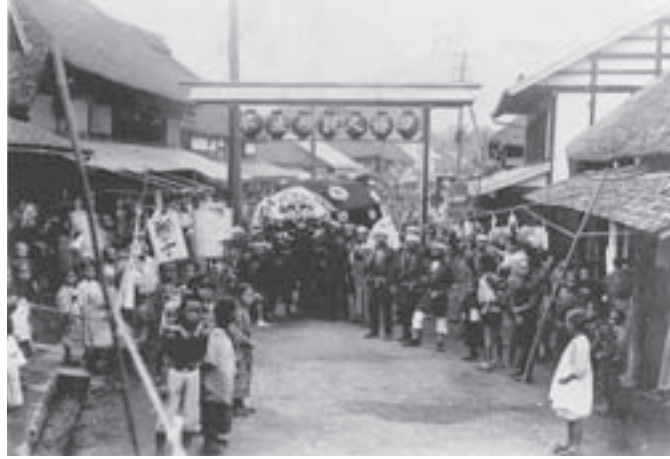
大正15年頃の祭りの様子