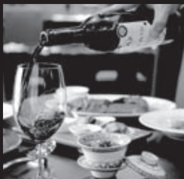
旬の味覚と確かな技が喜びを創りだす レストラン&バー