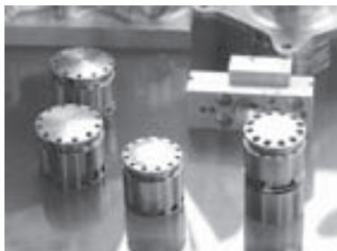
自動車ブレーキ部品

2015年11月12日、国産初のジェット旅客機・MRJが初飛行に成功しました。航空宇宙産業に関わる長野県内企業にとっても、市場拡大へ大きな期待を抱かせるフライトでした。