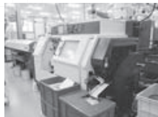
超高精度真円度加工を実現

親会社には「治工具の供給は不要」とアピール。少しずつ他の部品の受注を増やしていきました。結局、対物レンズ部品も製造技術が改めて高く評価され受注が復活。現在も主要メーカーとして供給を続けています。