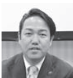
西沢 正隆 長野県議会議長