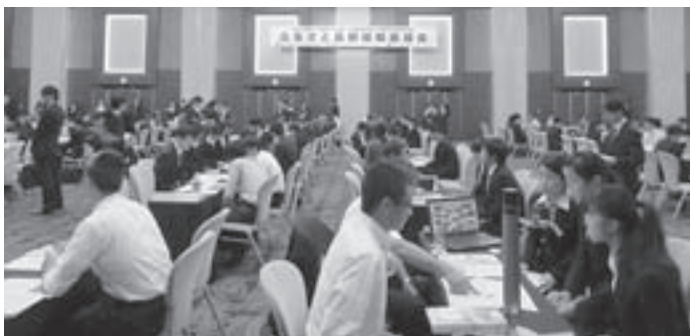
ふるさと長野就職面接会 (H27/9/17、長野市) の様子

面接会直前セミナーを含め、参加申込は不要です。筆記用具持参で直接会場にお越しください。