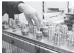
光学機器メーカーに納める精密金属加工品

顕微鏡用精密金属部品、ライフルスコープ用鏡枠など、光学分野を中心とする精密金属加工を手がける、川手製作所。創業以来の独自技術に磨きをかけ、積極的な設備投資によりさらに高い技術レベルを追求。大手光学機器メーカーをはじめとする顧客から高い信頼を得て、医療機器にも領域を広げています。